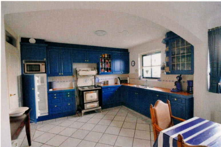
De 'herkenbare witte huisjes met rieten dak' waren allemaal voorzien van een oud-Hollandse keuken met antiek fornuis , 2000.

Langzamerhand waren er ook plannen ontstaan voor parken waarbij de ondernemers of ontwikkelaars de belevingswaarde van de omgeving niet in de vorm van stijlelementen maar in de vorm van bebouwingsspatronen wilden laten terugkomen en die daardoor een wezenlijk andere opzet kregen dan hun voorgangers. Een voorbeeld was het plan voor de Hof van Saksen in Nooitgedacht in Drenthe. De ondernemer die het failliet gegane park had overgenomen, de ontwikkelaar Phanos, kondigde in 2001 aan het park te willen omvormen tot een super-de-luxe vakantiepark met 400 huizen in de vorm van een Drents boerderijdorp. Hij hoopte hiermee mensen te trekken die normaliter niet zo snel voor het vakantiepark zouden kiezen, zoals vermogende rustzoekers en zakenlieden. Het luxueuze plan was een opsteker voor de provincie, die vanaf eind jaren negentig de nodige kritiek over zich heen gekregen had. Begin jaren negentig was Noord-Drenthe al als waardevol cultuurlandschap (WCL) aangewezen, maar de provincie had daar weinig mee gedaan. In 1997 hadden zeven 'wijze mannen', waaronder oud-ministers en topmannen uit het bedrijfsleven, op een discussiebijeenkomst over de toekomst van Drenthe 'passiviteit' geconstateerd en gesteld: 'Drenthe moet vaker en met meer lef haar groene imago verkopen'. 302 Gedeputeerde Staten hadden vervolgens – in navolging van Friesland en wellicht wakker geschud door de World Tourist Organisation (WTO),