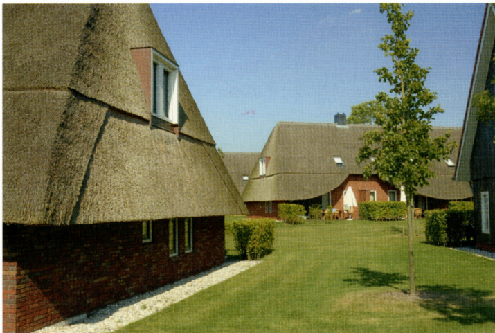
De door Kalfsbeek ontworpen boerderijvolumes rondom de gemeenschappelijke brink.

Kalfsbeek zorgde ervoor dat het idee van Ensing een meer eigentijdse invulling kreeg. Hij gebruikte de grove vormtaal en het materiaal van de oude Saksische boerderijen, maar verwerkte deze tot moderne boerderijvolumes. Zo koos hij voor een grote, laaghangende rieten kap met overstekken en uitsparingen. De overstekken creëerden beschutting voor de terrassen, terwijl de uitsparingen voor voldoende daglicht in de vakantiehuizen zorgden. Kalfsbeek trok de belijning van de uitsparingen door in de rieten kap en plaatste de dakramen ertussen. Kalfsbeek wilde per se riet: 'Riet was vroeger het goedkoopste materiaal, nu het duurste. Ik heb de daken zo ontworpen dat het riet niet uit bezuinigingsoverwegingen door dakpannen vervangen kon worden. 1308 Al met al waren de boerderijvolumes, in de woorden van Bleeker, vooral 'kloek' en 'eigentijds'. De landhuizen die hiertussen lagen, oogden door hun rode dakpannen en donker houten betimmeringen, als bijbeho-