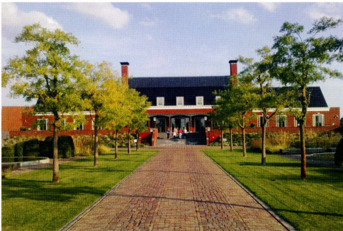
Phanos wilde aanvankelijk een kopie van Laarwoud, de havezate van Zuidlaren, laten verrijzen. Kalfsbeek ontwierp een meer eigentijdse variant