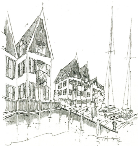
De Pieterman 1997'str'vb'elch'n' appartementen

Het esdorp als inspiratiebron had de opzet van het vakantiepark dan wel veranderd, maar die verandering was in het niet gevallen bij de veranderingen die twee andere plannen die al voor de Vijfde nota waren ontstaan met zich meebrachten. Een daarvan was het plan voor het Marinapark Volendam. Al in 1986 was in een door Ballast Nedam opgesteld toeristisch ontwikkelingsplan Edam-Volendam – met de optimistische titel Feeling young, feeling strong – voorgesteld om op de voormalige vuilstort De Pieterman, ten zuiden van het veelvuldig door dagjesmensen bezochte Volendam, verblijfsrecreatie te realiseren, om precies te zijn een vakantiepark voor Nederlanders met een hotel voor buitenlandse toeristen. Hoewel dat voorstel toen bij gebrek aan draagvlak niet was doorggegaan, was het wat de gemeenteraad betrof nooit helemaal van de baan geweest. Toen het Recreatieschap begin jaren negentig had aangegeven een plan te willen maken voor de Markermeerkust, had het gemeentebestuur meteen de Heidemij uitgenodigd om een Oeverplan op te stellen. In dat plan, dat in 1993 verschenen was, had de Heidemij op de Pieterman opnieuw verblijfsrecreatie in de vorm van een vakantiepark en hotel geprojecteerd, maar nu nog aangevuld met een camperhaven, een