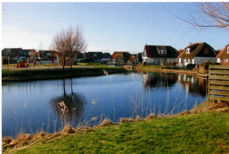
De door Marcel Coltof ontwikkelde Buitenplaats Callantsoog moest een oud-Hollandse sfeer uitstralen, 2000.